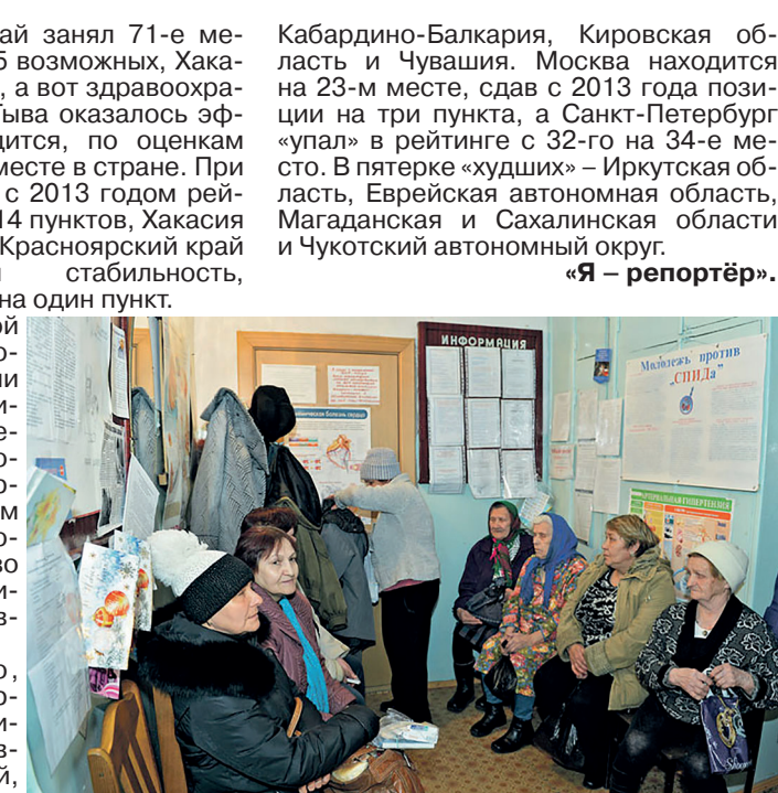
«Я – репортёр».

Красноярский край занял 71-е место в рейтинге из 85 возможных, Хакасия – на 79-м месте, а вот здравоохранение Республики Тыва оказалось эффективнее и находится, по оценкам экспертов, на 58-м месте в стране. При этом по сравнению с 2013 годом рейтинг Тывы вырос на 14 пунктов, Хакасия опустилась на 15, а Красноярский край продемонстрировал стабильность, сдав позиции всего на один пункт. Причинами низкой эффективности авторы рейтинга назвали «неверные приоритеты в расходах, дефицит врачей, особенно в амбулаторно-поликлиническом звене, неудовлетворительное качество медпомощи и дефицит грамотных управленцев». Примечательно, что в первую пятерку попали Республика Дагестан, Ставропольский край,