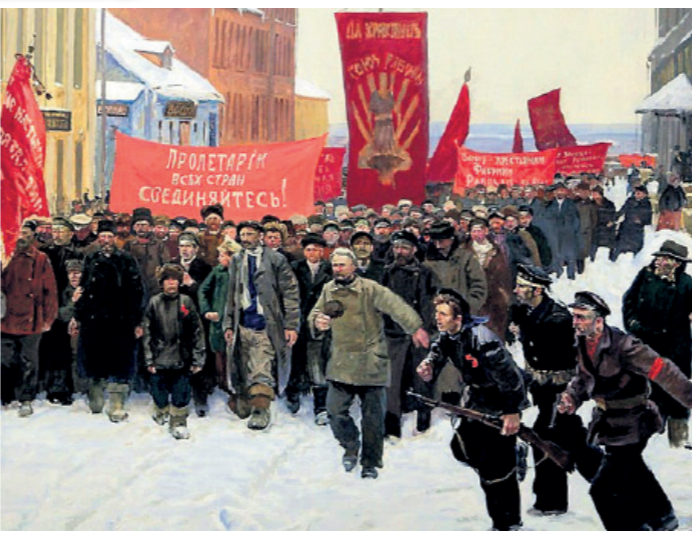
Красные охранные формирования в Керчи 1918 года.

Вот что о том врангелевском периоде пишет Исаак Бабель: «Бойцы наши, видавшие виды, отрубившие не одну голову, отступили в ужасе перед картиной, пред-