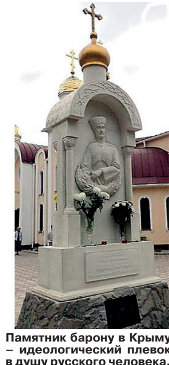
Памятник барону в Керчи — идеологический плевок в душу русского человека.