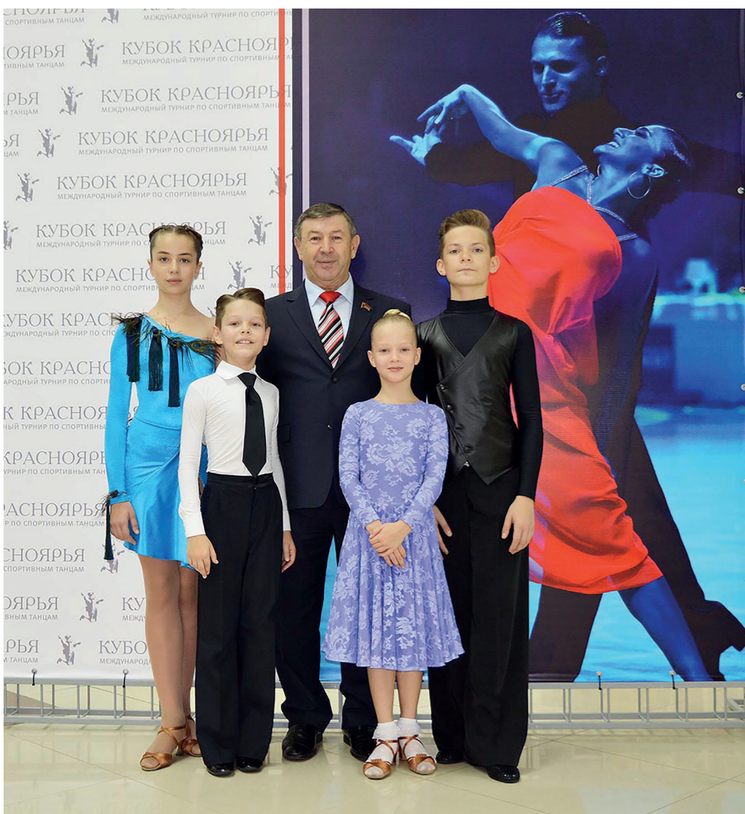
В Красноярск прошел турнир «XX кубок Красноярья» по танцевальному спорту. Участвовали в нем принимали более 800 пар различного возраста. В рамках турнира проходили рейтинги Союза танцевального спорта России по европейской и латиноамериканской программам.

Почетным гостем турнира был первый секретарь крайкома КПРФ Петр Медведев. По его словам, турнир по бальной хореографии прошел на высоком уровне. Он показал молодость, красоту и грацию прекрасного вида искусства.