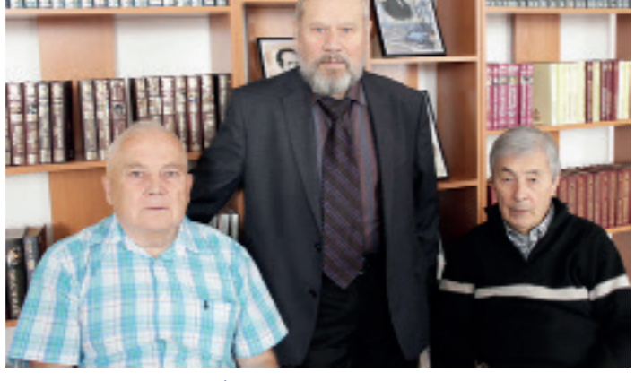
Из блокнота журналиста