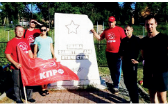
Берёзовские коммунисты и комсомольцы провели акцию-пикет, посвященную 75-летию начала Великой Отечественной войны, а также «АнтиНАТО».

Для земляков была организована выставка чёрно-белых фотографий военных лет, советских книг о войне, где каждый пришедший на акцию мог взять любую книгу себе на память. В блоке «Белые журавли памяти» мы предлагали желающим изготовить журавлика из бумаги и отнести к памятнику героям Великой Отечественной войны и таким образом отдать дань памяти павшим солдатам той страшной войны. Одна из целей акции — протест против установки памятной доски в Санкт-Петербурге финскому генералу-фашисту Карлу Маннергейму. Мы за то, чтобы молодежь лучше знала историю, больше читала. Активно прошла акция «Свеча памяти». На четырех автомобилях ребята проехали по району, зажгли и установили свечи памяти к монументу героям Великой Отечественной войны.