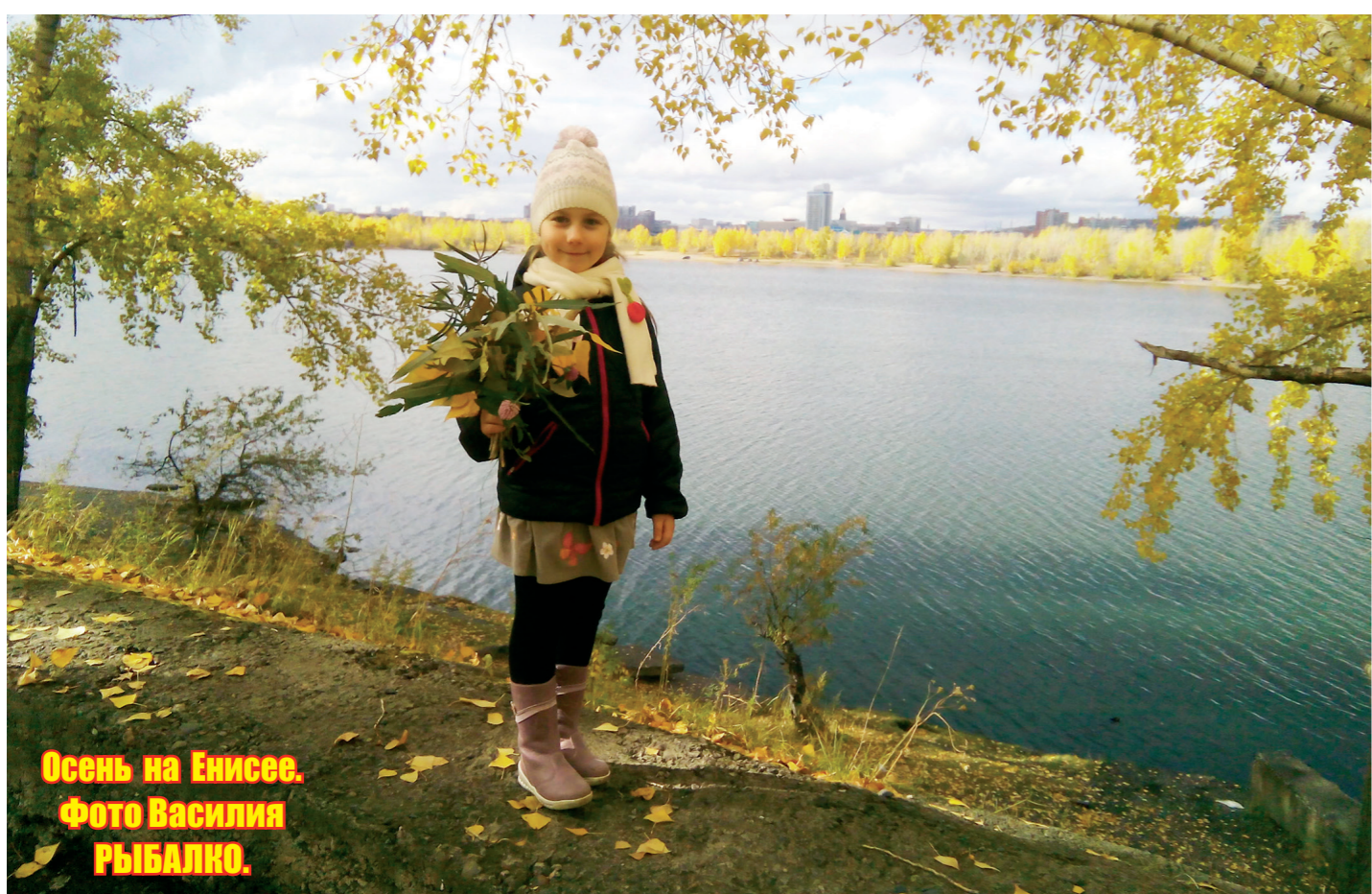
Осень на Енисее.