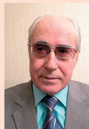
Юрий НИКОТИН, политический обозреватель