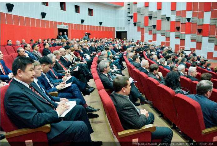
Окончание. Начало на 1-й стр.

цию. А российская делегация даже была вынуждена досрочно покинуть ПАСЕ.