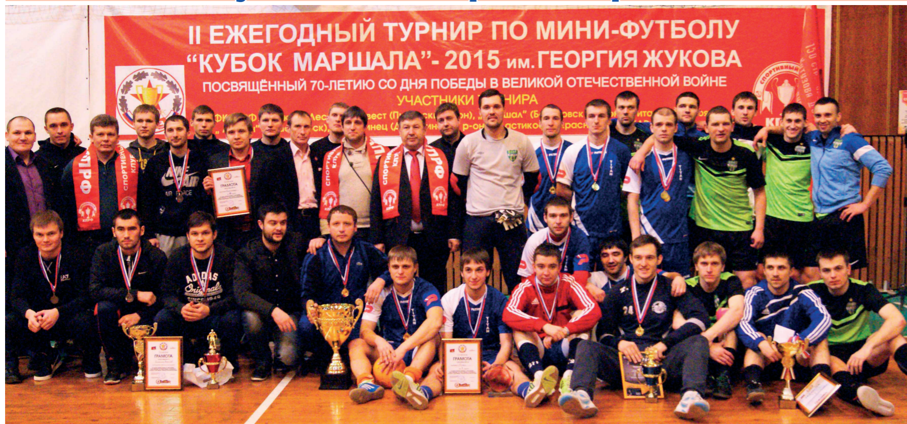
Этот групповой снимок сделан на финале II краевого турнира по мини-футболу. Кубок Маршала был посвящен 70-летию Победы в Великой Отечественной войне.