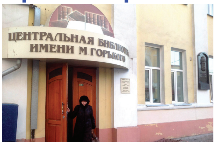
Центральная городская библиотека им. А. М. Горького Красноярск отмечает 125-летний юбилей.

За многолетнюю историю сменилось не одно поколение читателей и библиотекарей. Неизменным осталось стремление и умение специалистов библиотеки работать профессионально, качественно, отдавая любимому делу частичку души и сердца.