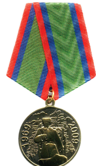
Река Уссури. Снег везде. Лишь впереди темнеет остров. И враг, крадущийся во тьме, На берег наш незваным гостем. То было ранней весной. В отряд сигнал пришел с границы. На острове Даманский бой. Идым над сопками клубится. Солдаты встали, как стена, Не пропустит врача за реку, Где не забудут имена Героев надо помнить вечно.

К 45-й годовщине событий на острове Даманский