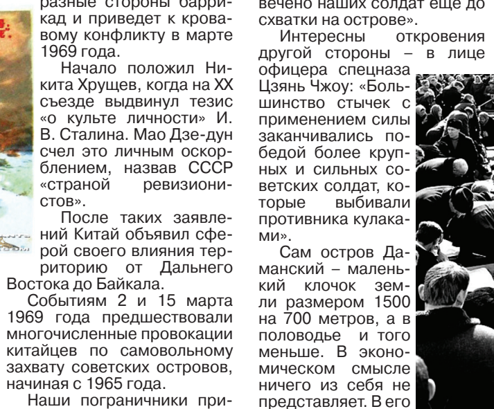
祖国山河不容侵犯!

обострением обстановки на советско-китайской границе объявило призы молодежи, прошедшей армейскую школу, для продолжения службы на дальневосточных рубежах Советского Союза.