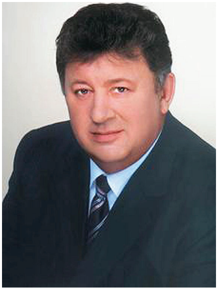
Владимир КАШИН, заместитель Председателя ЦК КПРФ, председатель комитета Госдумы по природным ресурсам, природопользованию и экологии, академик РАНСН

Ситуация в стране более чем тревожная. Мы прямой дорогой идём к обвалу финансово-экономической системы.