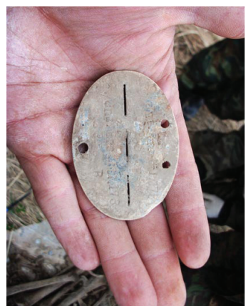
Поисковым отрядом предстоит сделать еще очень много работы. Ведь, как говорят, война не закон-

Работала в основном молодежь от 14 до 17 лет. Следить за всеми, а также руководить поисковой работой – большая ответственность.