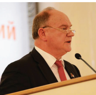
европейским стандартам, являются бедными.

Но прежде всего трудящиеся страны должны видеть нашу постоянную заботу. Они нуждаются в ней, поскольку лишены теперь самой элементарной защиты. 90% населения России, по