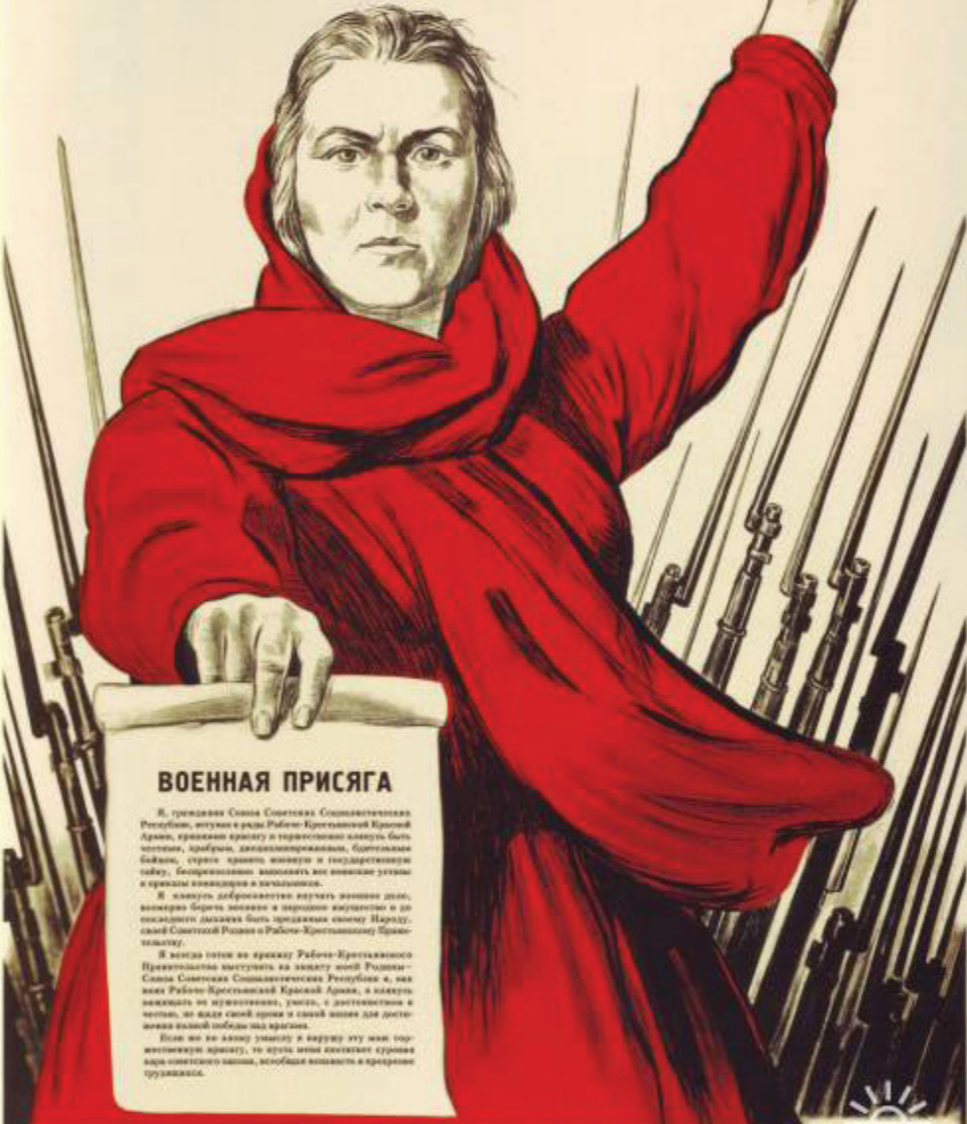
Комментарии к плакатам на Newsday.ru