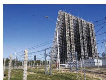
«Воронеж» на Алтае

Как известно, в свое время близ Енисейска строилась мощная радиолокационная станция (РЛС). Она уже была возведена, и оставалось лишь начать ее оборудование. Но лауреат Нобелевской премии мира предатель Горбачев дал команду демонтировать станцию, в которую было вложено пять миллиардов рублей. От Енисейской РЛС остались ныне одни руины. А время показало, что США и НАТО не отказались от агрессивных планов в отношении нашей страны. Америка нагло замещает системы ПРО вблизи границ России. РЛС нужны для безопасности нашего государства. Между тем руководство Азербайджана, где находится одна из крупнейших российских РЛС, заявило, что закрывает ее. В этой связи Кремлем принято решение заложить новую мощную РЛС под названием «Воронеж» на территории Алтайского края. Почему ее окрестили именем далекого от Сибири города, совершенно непонятно. Может, хотели тем самым сбить с панталыку противника? Так в Пентагоне не дураки сидят. У нас дураков куда больше. Того же Горбачева, по-хорошему, надо привлечь к уголовной ответственности за решение демонтировать Енисейскую РЛС и заставить раскопаться за нанесенный стране ущерб. Да вряд