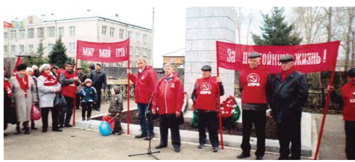
Сайт Фонда общественного мнения.