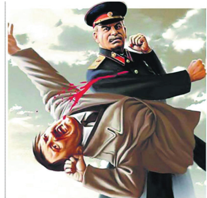
ПОБЕДИЛИ ГИТЛЕРА — ПОБЕДИМ ЖУЛИКОВ И ВОРОВ!