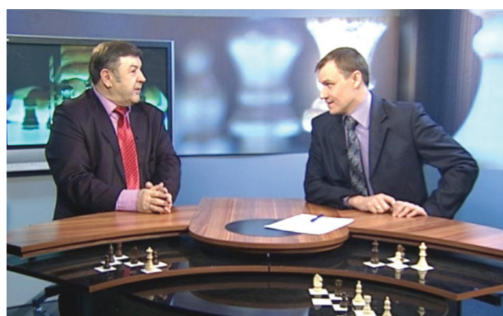
Объективно отражали ведущие СМИ России и мира.

Отчетный доклад съезду, который сделал лидер КПКРФ Г. А. Зюганов, Программа партии имеют огромное значение не только для коммунистов нашей страны, но и для братских партий всего мира. Это наша боевая платформа на ближайший период. Важно и то, что отчетный доклад ЦК был опубликован в СМИ за две недели до начала работы съезда, переведен на английский и испанский языки. Зарубежные гости четко представляли себе масштаб деятельности партии, ее тактику и стратегию. Работу съезда широко и, что немаловажно, относительно