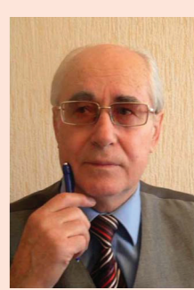
Юрий НИКИТИН, политический обозреватель

Т О, ЧТО В РОССИИ воруют, — не тайна. Это почти национальная особенность, как и великая тяга к спиртному. Не подумайте, что автор чернит свой народ. Боже упаси! Просто это общеизвестный, хотя и неприятный факт. Но такого гигантского размаха воровства, как в последние двадцать лет, страна с многовековой историей еще не знала! И, что принципиально важно, главные и крупные воруны в России XXI века — не простой люд, а высокооплачиваемые чиновники, включая министров и высокую администрацию.