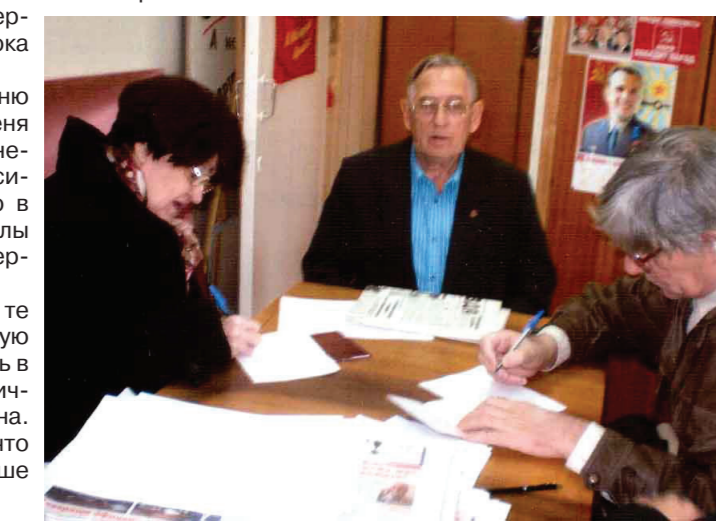
На нижнем снимке: зеленогорцы пишут заявления о вступлении в организацию «Дети войны».

Какая огромная разрушения оставила война. Было уничтожено 1700 городов, 70 тысяч сёл. Немцы сожгли вместе с населением 130 деревень в Белоруссии и 230 - на Украине. В Старорусском районе Новгородской области до войны было 369 деревень, а осталось 68! Сильно разрушена железная дорога, мосты. В 1946 году я переезжал поездом через реку Днепр около Запорожья по деревянному мосту. Старого моста не было. Когда поезд вышел на этот мост, то мост закачался, и мы в страхе все встали и ждали, чтобы скорее кончилось наше испытание.