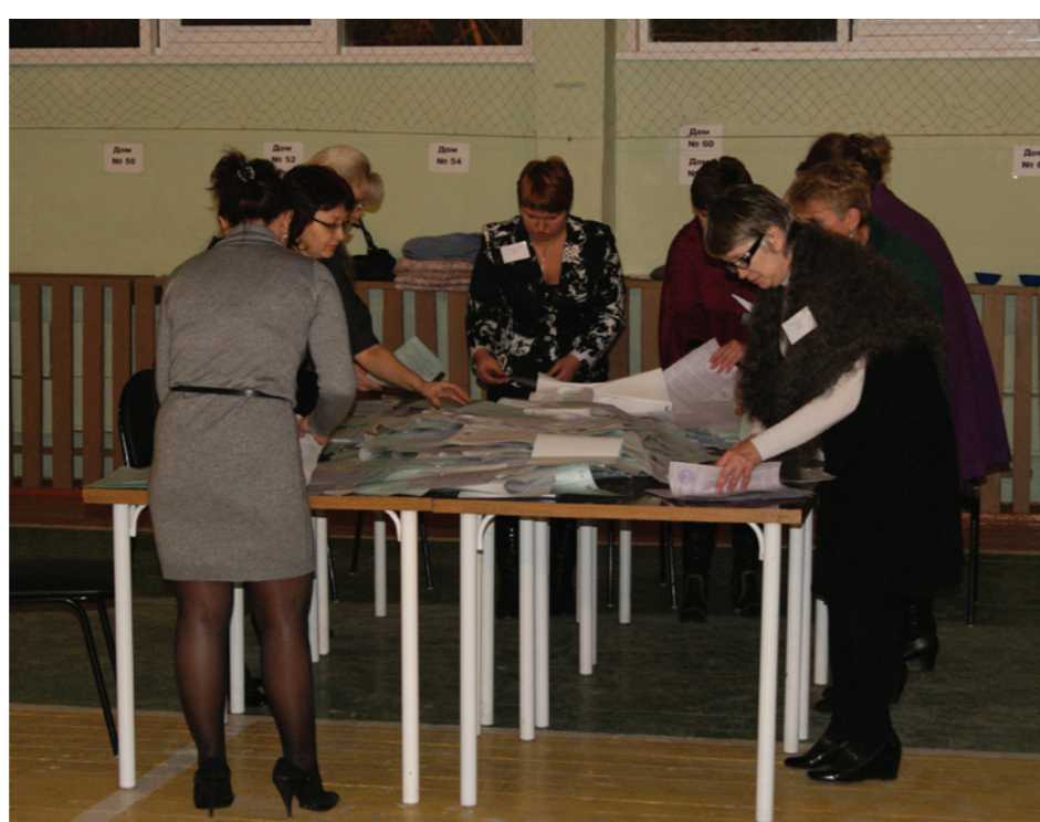
Вот так считали голоса на избирательном участке № 286 Ленинского района Красноярск. Наблюдателей и близко не подпустили...