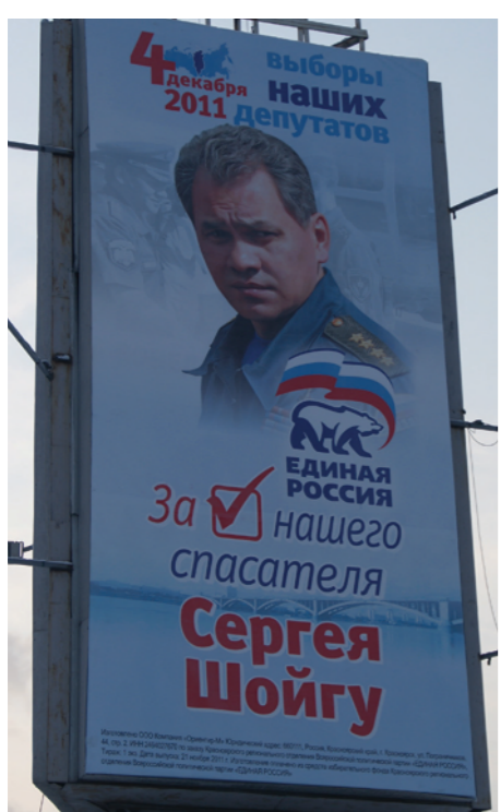
В день выборов баннеры призывали голосовать за «спасателя - спасителя». Черемшанка ещё не сгорела...