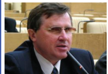
Олег СМОЛИН, депутат фракции КПРФ Государственной думы РФ, президент общества «Знание» России.

КРИЗИС МОРАЛИ. Дармовые деньги – основной наркотик демократической (рыночной) экономики и показатель начала ее прогнивания и распада.