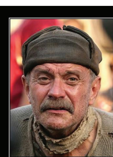
ПОМОГИТЕ НИКИТЕ ЮРИДИЧЕСКИ ВСЕГДА НА РУСИ ПОДАВАЛИ dematorm.com

Теперь корпус клеветников пополнился Никитой Михалковым. Утопленный слабой режиссер удостоился высокой оценки от известного чернителя советской эпохи, штатного тележуржиста Н. Сванидзе. Этот ярый антисоветчик так оценил картину: «Михалков снял фильм... полити-