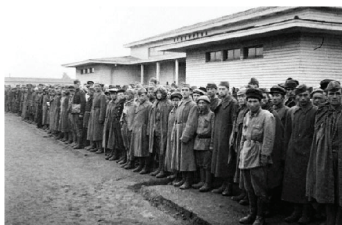
Солдаты в лагере «Дулаг-184».

69 лет его разыскивали как без вести пропавшего, а он – погиб. Всем нам хорошо знакомы слова: война не закончилась, пока не будет похоронен последний солдат. Возможно ли это? Войны всегда уносят жизни людей, останки которых чаще всего лежат вдали от родных мест. Образно говоря, у погибших одна могила на всех, название которой – Земной шар. На таком огромном пространстве сложно разыскать своих дедов и прадедов, наших спасителей. Во все времена святым долгом потомков было чтить память погибших героев и знать защитников по имени и фамилиям. До сегодняшнего дня сердца людей не отпускает война. Она принесла не только голод, разруху, но и миллионы умерших и пропавших без вести. Люди погибали на поле боя, в горящих домах, под бомбами и снарядами. Много жизней унёс плен, который забирал у людей не менее дорого – их свободу. С самого начала войны методы обра-