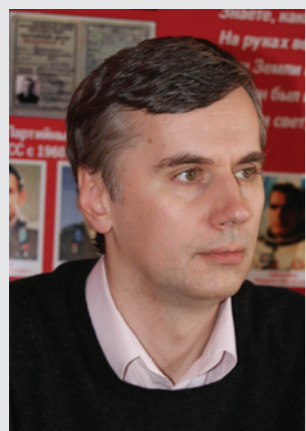
А. Н. АМОСОВ: «За годы реформ под лозунгом идеологизации в школе уничтожена система ценностей, характерная для России».

Наша партия — единственная, кто долгие годы последовательно защищает образование и науку