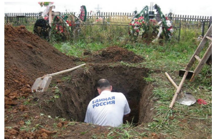
Позор партии власти!