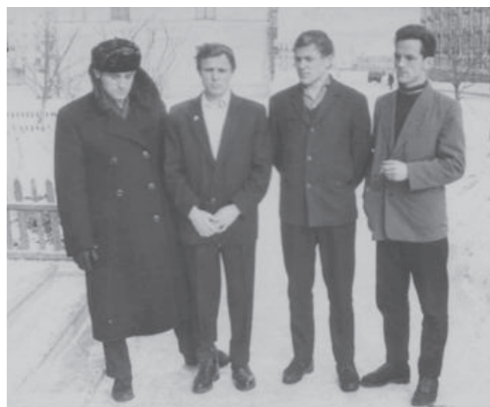
И еще одно воспоминание о характере советской эпохи. Даже техникум давал производству классных специалистов. Их знания и опыт настолько были востребованы, что никто не стремился избавиться от пенсионеров. Наоборот, их приглашали в расчет на то, чтобы они передали опыт молодым, наладили работу там, где что-то не ладится.