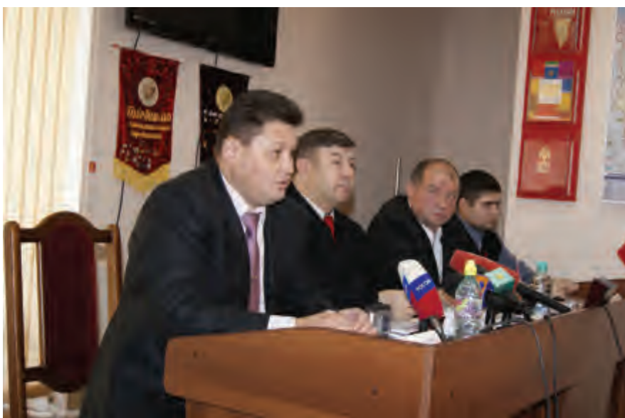
В краевом комитете КПРФ прошла пресс-конференция, посвященная итогам XXXIX краевой отчетно-выборной конференции и месту краевой организации КПРФ на политическом поле края.