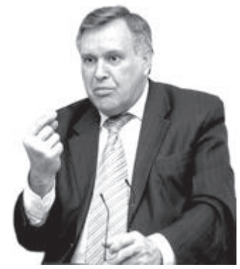
Виктор ИЛ'ЮХИН, депутат фракции КПРФ Государственной думы

Я ВСЁ больше убеждаюсь, что в России произошло губительное нарушение закона равновесия. Когда баланс нарушен, где-то накапливаются негативы, и все взрывается! Вот у нас и взорвалось. Я вижу четыре причины, из-за которых мы имеем сегодня катастрофу с пожарами.