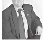
Сегодня звучит много ослухов на кризис: очень удобные оправдания провалов, неудач, топтания на месте. Но трагедия началась не в нынешний кризис. Для начала разговора приведу несколько цифр и фактов.

называть вещи своими именами и дать им историческую оценку людям. Геннадий Зюганов в Общественном ЦК КПРФ «Путь России вперёд, к социализму» называет шесть преступлений режима перед народом. Они широко известны, но они надолго постоянно напоминают людям. В этих условиях КПРФ предлагает программу возрождения России, которую мы коммунисты видим только на пути народолюбия и социализма.