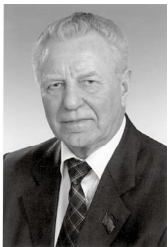
75-летие Красноярского края - это знаменательное и волнующее событие для каждого из нас сибиряка-красноярца. История края напоминает историю коренных сибирских народов...

Выступление на торжественном собрании в честь 75-летия Красноярского края