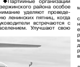
Image description: A photograph of a building, possibly a school or administrative building, mentioned in the 1979 report.