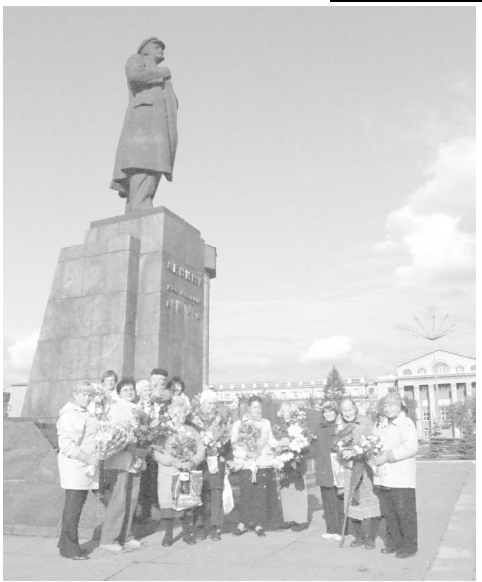
Подари букет Ильичу