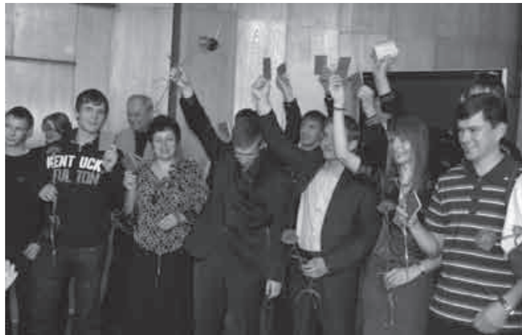
На XXXVIII краевой партийной конференции групп молодых коммунистов были вручены партийные билеты.

встать под наши знамена. И одно дело, когда это закаленный жизнью и убежденный человек, который сформировался при советской власти в советских традициях. Такого агитировать особенно не приходится. Другое дело — молодой человек, который только начинает жить. Важно, чтобы он правильно ориентировался в потоке событий, давал им правильную оценку, шел нога в ногу с правдой. Скорее всего, именно этим объясняется то, что молодые люди рано или поздно находят нас, коммунистов.