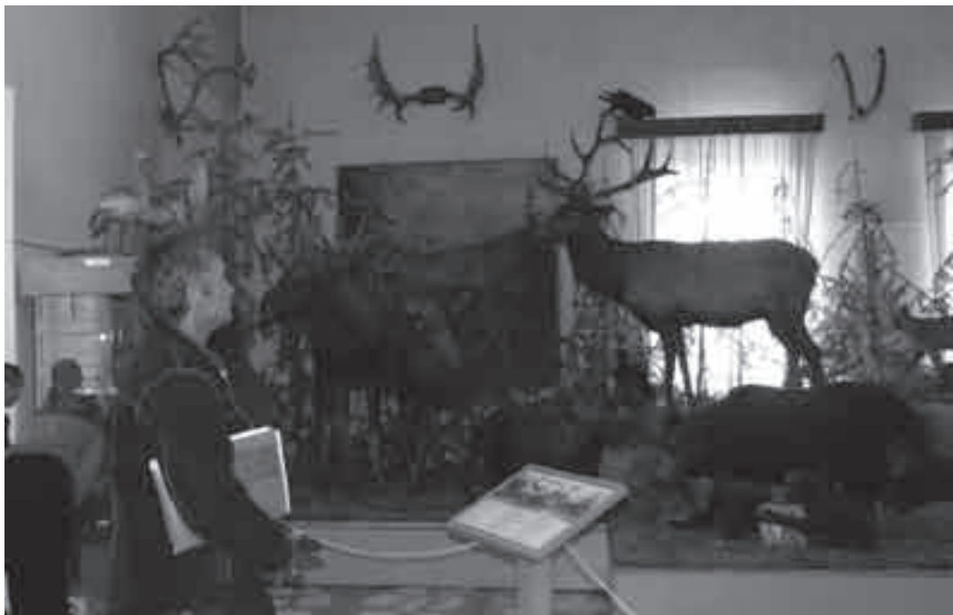
Музей имени Н. М. Мартыанова просто впечатляет. Здесь собраны ценнейшие материалы об истории, этнографии, фауне и флоре края. Снимок сделан в зале, рассказывающем о природном мире.