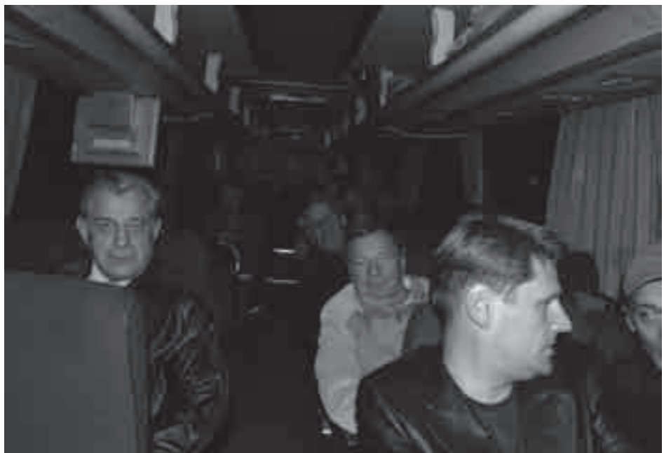
Снова в дорогу. В комфортабельном автобусе не замечаешь дальних расстояний, а время летит незаметно.