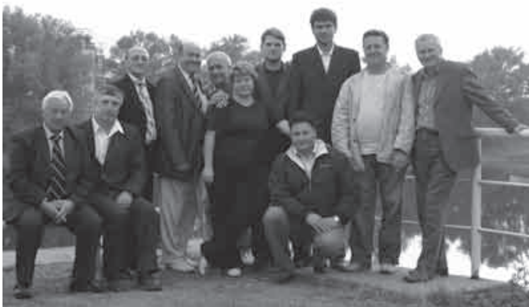
Многие захотели сфотографироваться на память.