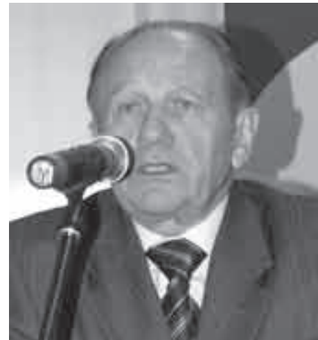
ном объеме информируем население о проделанном.

Могу твердо сказать, что практически все наказания, данные коммунистам, выполнены. Хотя надо признать, что мы не всегда оперативно и в пол-