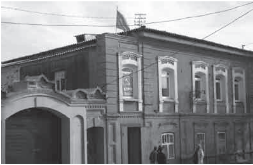
Над зданием горкома – в самом центре города! – гордо реет красный флаг.