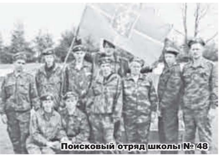
Поисковый отряд школы № 48

22 апреля школа № 48 Ленинского района проводила поисковый отряд «Енисей», который направлялся на раскопки в Новгородской области в местах боев Великой Отечественной.