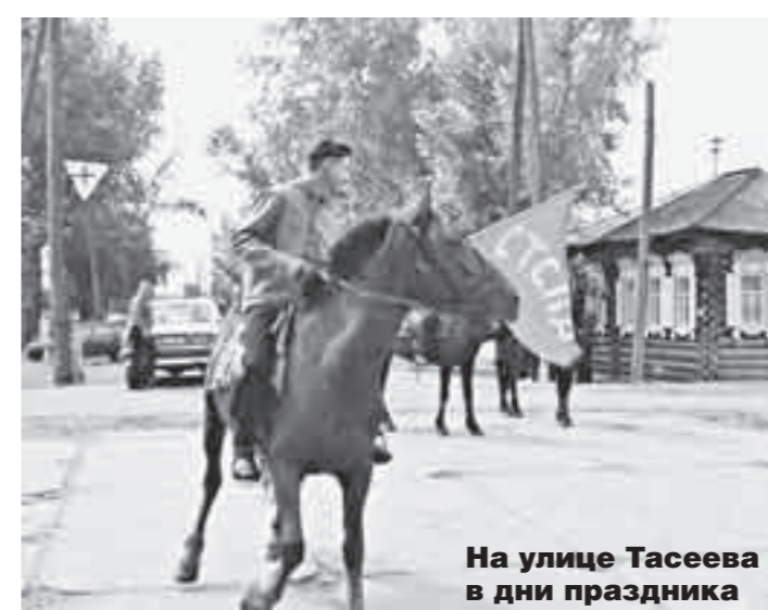
На улице Тасеева в дни праздника

Что касается колчаковцев, то они не жалели патронов ни в открытом бою с партизанами, ни в борьбе с мирным населением. К примеру, после вынужденного отступления партизанской армии из Тасеева летом 1919 года каратели расстреляли в столице республики и в соседнем селе Троицк более двухсот стариков, женщин и подростков. По рассказам очевидцев и фотографиям, найденным у колчаковцев, которые до сих пор хранятся в музее, приговорённых к смерти ставили на краю круглого берега реки Усолки и стреляли в затылок. Тяжёлая винтовочная пуля превращала лицо обречённого в сплошное месиво, и родственники узнавали отца, мать или брата лишь по одежде. А в Троицке после такого расстрела вода в реке так