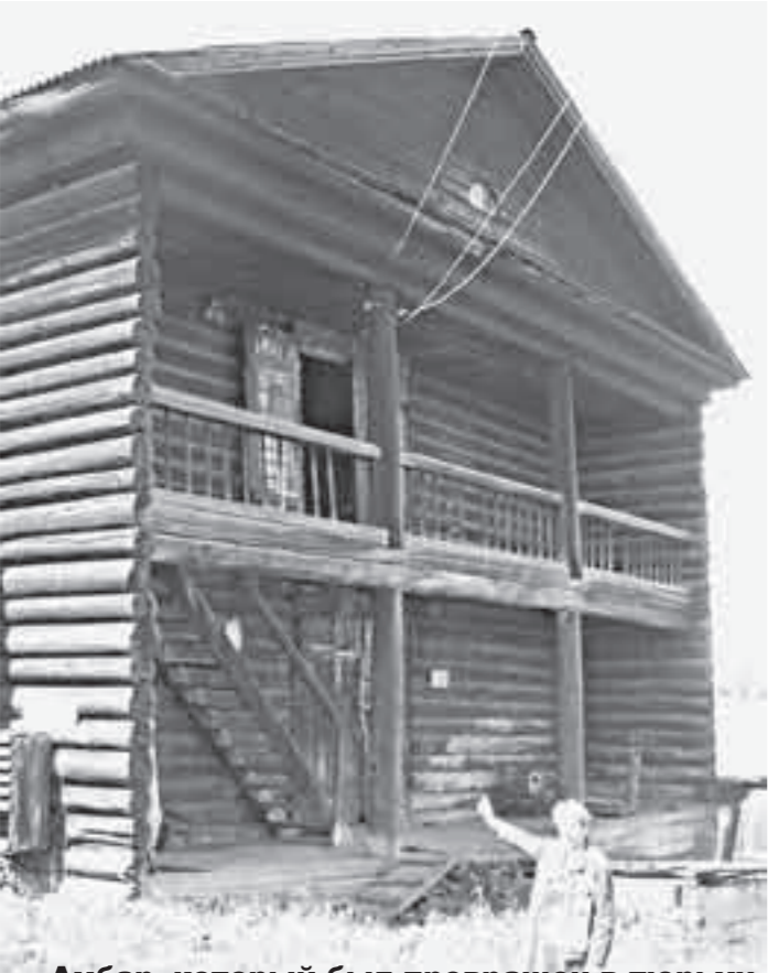
Амбар, который был превращен в тюрьму

Виктор РЕШЕТЕНЬ, собр. корр. «Красноярского рабочего». Тасеевский район.