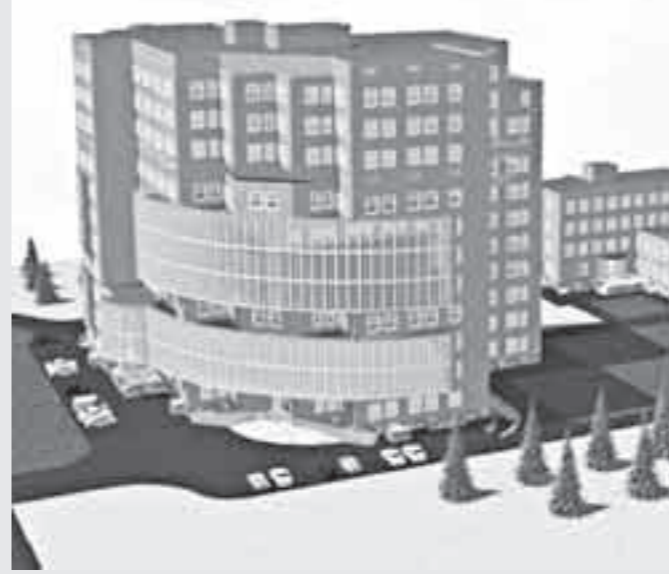
↗ Проект хирургического корпуса онкологического диспансера в г. Красноярске